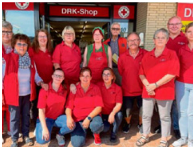
Ehrenamtliche aus dem DRK-Team des Kleidershops.

So wie sich die Örtlichkeiten im Wandel der Zeit verändert haben, hat sich in gleichem Maße das Angebot weiterentwickelt und aufgrund des hohen Bedarfes, der hohen Nachfrage und auch des gesellschaftlichen Wandels hin zur Nachhaltigkeit, entstanden aus einer DRK-Kleiderkammer in Hann. Münden mittlerweile zwei DRK-Shops. Einer ist in der Burgstraße 7 in Hann. Münden zu finden, war jedoch leider aufgrund eines Wasserschadens bis Ende August 2023 vorübergehend geschlossen. Der zweite, entstanden im Oktober 2013, befindet sich in der Wilhelmshäuser Straße 40, ebenfalls in Hann. Münden und besticht durch sein wohlsortiertes, großes Angebot. Seit Juli 2022 präsentiert dieser DRK-Shop auf 410 Quadratmetern hell gestalteter Flächen neben Bekleidungsstücken auch