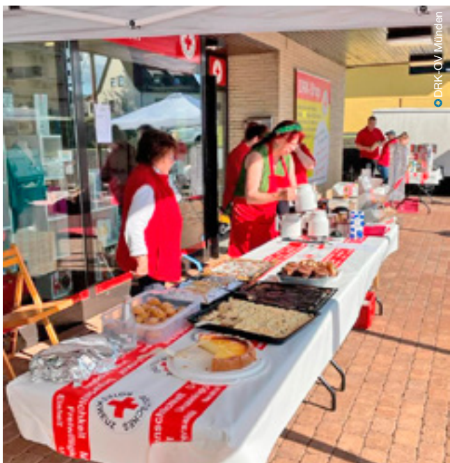
Bei den Vorbereitungen der Ehrenamtlichen zum 10-jährigen Jubiläum des DRK-Kleidershops Hann. Münden.

te Kleiderkammer des Ortsvereins konnte auf 27 Quadratmetern umgesetzt werden. Dort gab es Bekleidung, Bettwäsche und Handtücher.