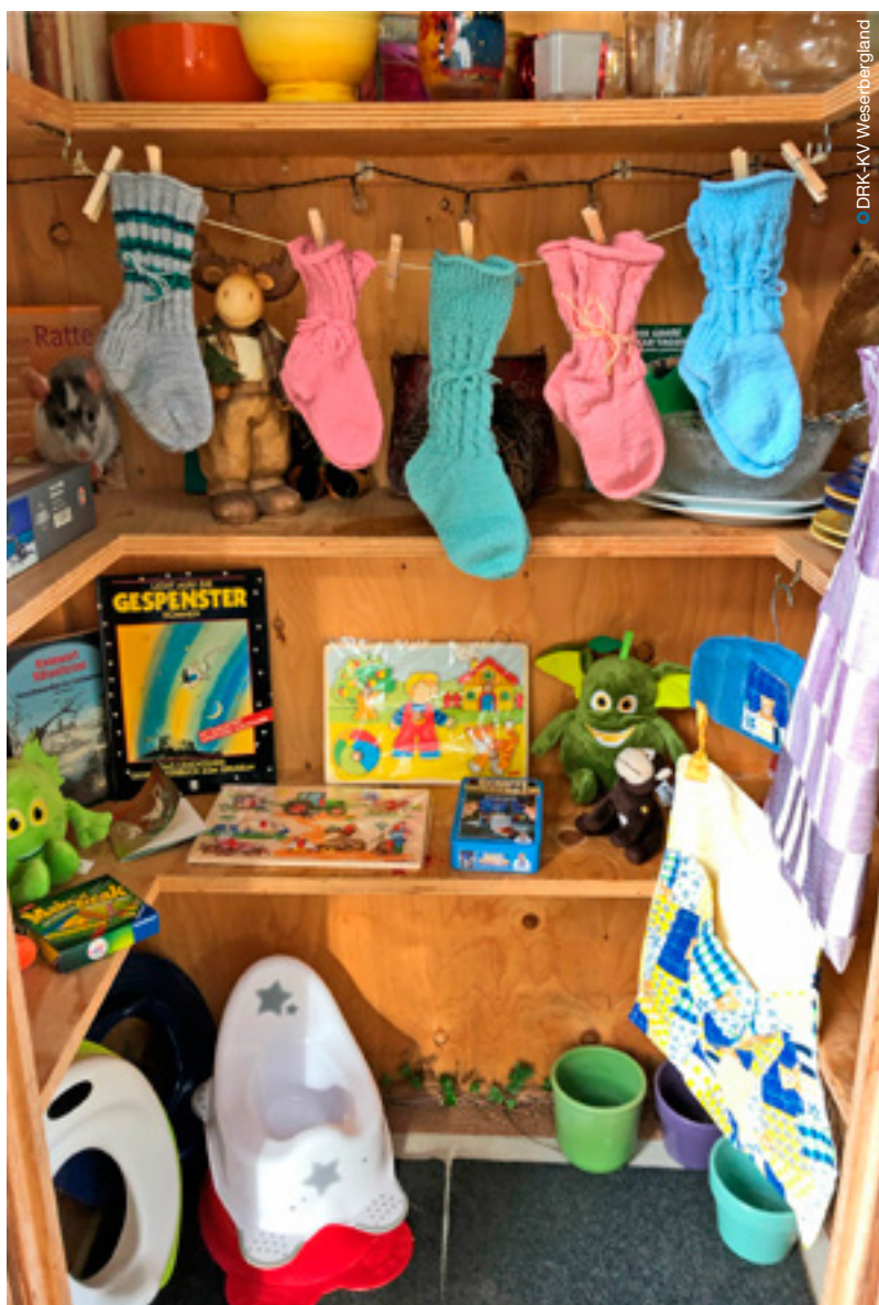
So kann beispielsweise ein Geben- und Nehmen-Schrank aussehen.

Darüber hinaus gibt es im Kreisverbandsgebiet auch Altkleidercontainer. Gut erhaltene Sachen werden an die Kleiderkammern in der Zuständigkeit des DRK-Kreisverbandes gegeben. Den größeren Teil, meist beschädigte und nicht mehr tragbare Textilien, gibt das Rote Kreuz an eine Verwertungsgesellschaft, welche die wertvollen Rohstoffe weiterverarbeitet. So entstehen zum Beispiel Fußmatten, Autositzbezüge oder Putzlappen. Mit dem Erlös aus der Weitergabe an die Verwertungsfirma kann das DRK die Jugendarbeit, die Kleiderkammern selbst oder die ehrenamtlichen Bereitschaften unterstützen, etwa für Ausrüstung, die im Katastrophenschutz benötigt wird.