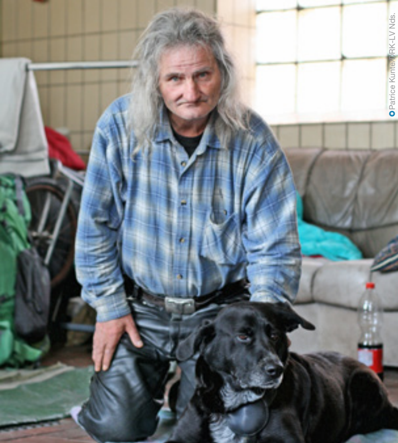
Patrice Kumbé/DRK-LV Nds.