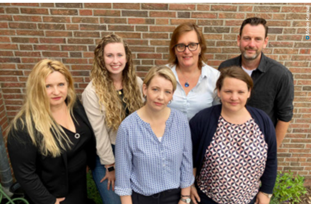
Das Team der Familienhilfe.