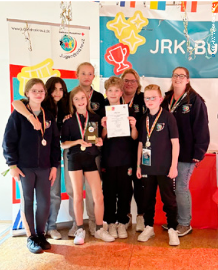
Starke Leistung: Sieger im SSD-Bundeswettbewerb!