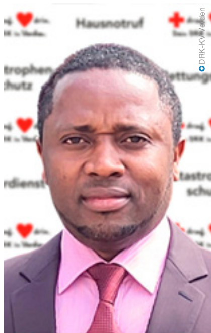
Foto aufgenommen in einer DRK-Beratungsstelle für Geflüchtete in Hamburg.