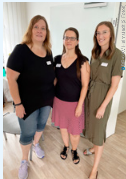
DRK-KV Helmstedt (2 Fotos)

Vater-Kind-Tag: Boote aus Verpackungsmaterial werden zu Wasser gelassen.