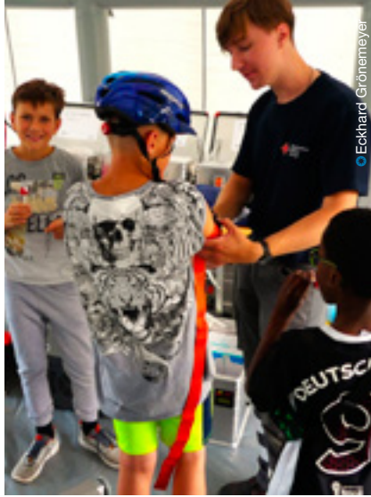
DRK Wittlage: Sanitätsdienst präsentiert sich beim Tag des Roten Kreuzes.