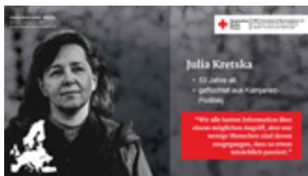
Eindrücke von der Ausstellung „Gesichter einer Flucht“.